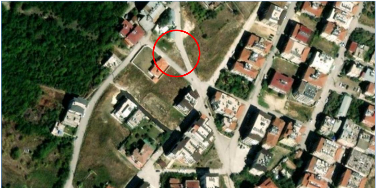
Harita 1: Plan Değişikliği Alanının Uydu Görüntüsü

Bahse konu plan değişikliği alanı TKGM' de Aşağıokçular Mahallesi sınırları içerisinde Atatürk 2 caddesinin doğusunda yer almaktadır. Planlama alanı, 1/1000 ölçekli hâlihazır haritalarda, P36D08B3B paftasında kalmaktadır.