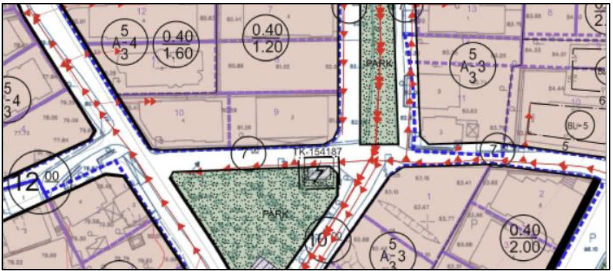
Harita 3: Plan Değişikliği Alanının Teklif 1/1000 Uygulama İmar Planındaki Durumu

Hazırlanan Uygulama İmar Planı değişikliği Aşağıokçular Mahalle içerisinde; P36D08B3C 1/1000 ölçekli Uygulama İmar paftasında, 129 ada 9 no'lu parsel güneyinde tescil harici bölgede yer alan Park Alanı içerisinde belirlenen ölçülerde yaklaşık 8*5 (40 m 2 ) Trafo Alanı olarak planlanmıştır. İlgili Kurumlar ile yapılan görüşmeler sonucunda; Enerji Piyasası Düzenleme Kurumunun trafo tesislerine ait işi kapsamında imar plan değişikliği ile Trafo Alanı planlanmıştır. Belirtilmeyen hususlarda 3194 sayılı İmar Kanunu ve bağlı yönetmelik hükümlerine uyulacaktır.