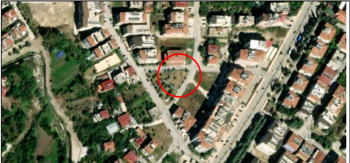
Harita 1: Plan Değişikliği Alanının Uydu Görüntüsü

Bahse konu plan değişikliği alanı TKGM' de Aşağıokçular Mahallesi sınırları içerisinde Çınar 1 sokağın güneyinde yer almaktadır. Planlama alanı, 1/1000 ölçekli hâlihazır haritalarda, P36D08B3C paftasında kalmaktadır.