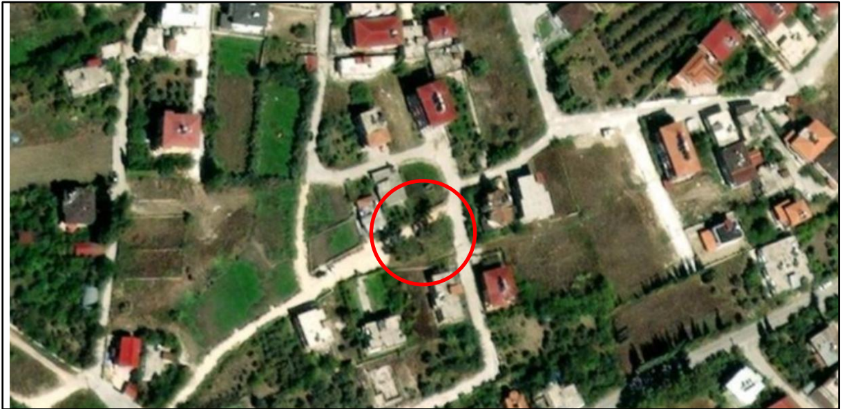
Harita 1: Plan Değişikliği Alanının Uydu Görüntüsü

Bahse konu plan değişikliği alanı TKGM' de Aşağıokçular Mahallesi sınırları içerisinde 2123 sokak kuzeyinde yer almaktadır. Planlama alanı, 1/1000 ölçekli hâlihazır haritalarda, P36D08C1B paftasında kalmaktadır.