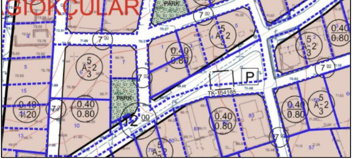
Harita 2: Plan Değişikliği Alanının Meri 1/1000 Uygulama İmar Planındaki Durumu

1/1000 ölçekli Uygulama İmar Planı kapsamında, P36D08C1B paftasında yer alan Planlama Alanı, Otopark Alanı olarak mevcut planlarda işaretlenmiştir.